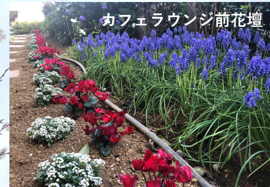
カフェラウンジ前花壇

多摩川沿いを散歩後、東急REIホテルでランチを予定しておりましたが、 コロナ感染予防のため残念ながら中止になりました