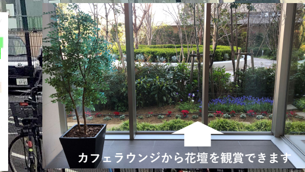
カフェラウンジから花壇を観賞できます